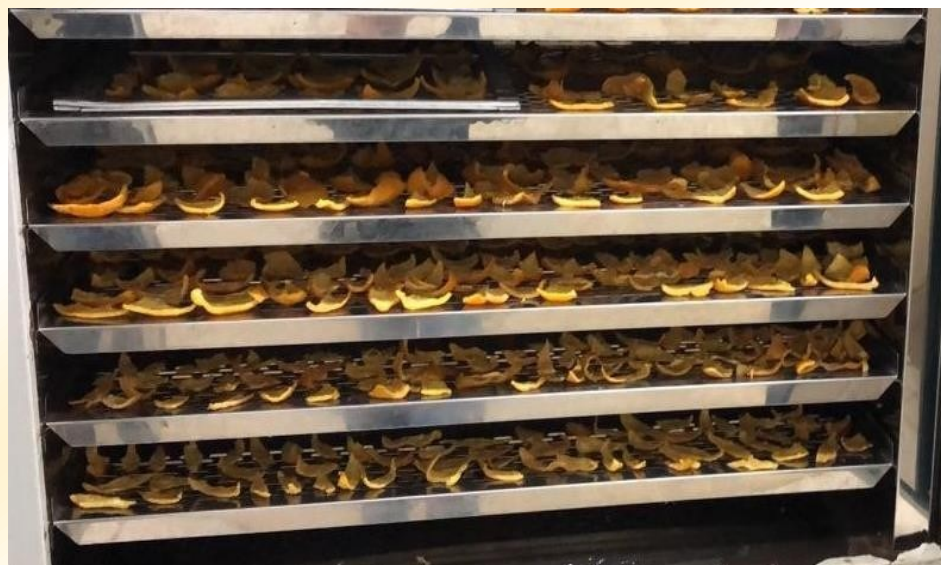
Figura 1. Cascas de tangerina poncã submetidas à secagem por convecção forçada de ar.

submetidas à secagem em estufa com circulação e renovação de ar à 60 °C (400-TD, Nova Ética), durante 8 horas, com velocidade do fluxo de ar de 0,37 m/s (Anemometer, EUA), até atingir umidade final próxima de 15% p/p.